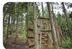
大亀山アスレチック