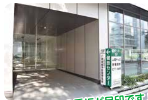
この看板が目印です!!

健診センターの看板がある入り口から入ります。車以外で来られた方は、ここの入り口からしか入れません。