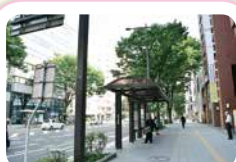
バス停留所 二日町北四番丁