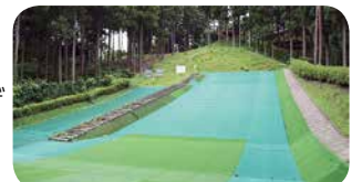
ちびっこゲレンデ