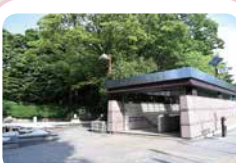
勾当台公園駅北2出口