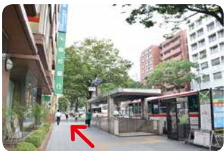
地下鉄出入口の横には仙台銀行さんがあります。 矢印の方向へ進みます。

ふれあい TeaTime では カメラを持って健診センターの周囲を探検してきました。 今回のキーワードは、「 緑色の看板 」です。