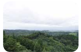
大亀山展望台からの眺望